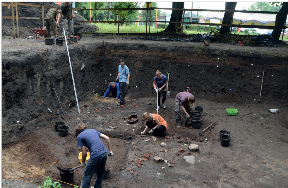
Ryc. 1. Stargard, przedmieścia miasta lokacyjnego, teren kaplicy św. Jakuba. Studenci eksplorują relikty domniemanego późnośredniowiecznego budynku lekkiej konstrukcji.