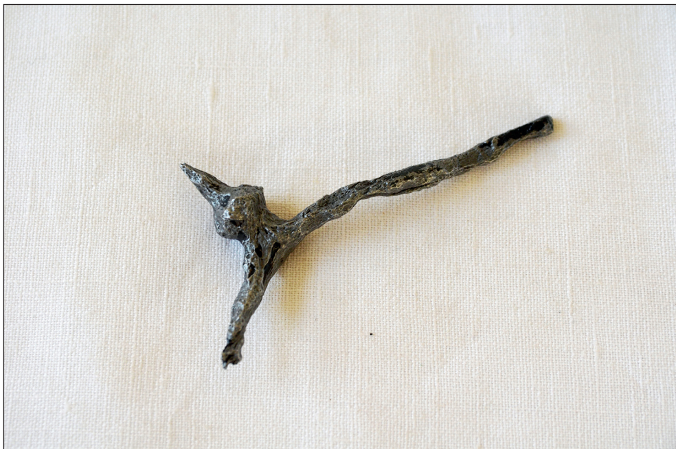
Ryc. 7. Żelazna ostroga pochodząca z badań archeologicznych w Stargardzie.