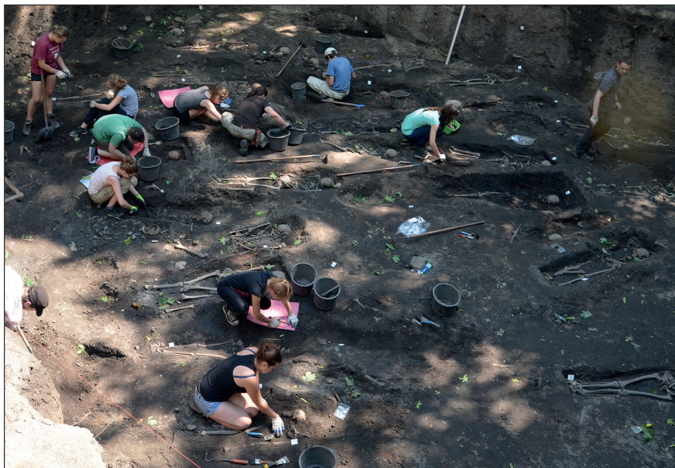
Ryc. 2. Stargard, przedmieścia miasta lokacyjnego, teren kaplicy św. Jakuba. Studenci eksplorują poziom pochówków XVIII-wiecznego cmentarza.