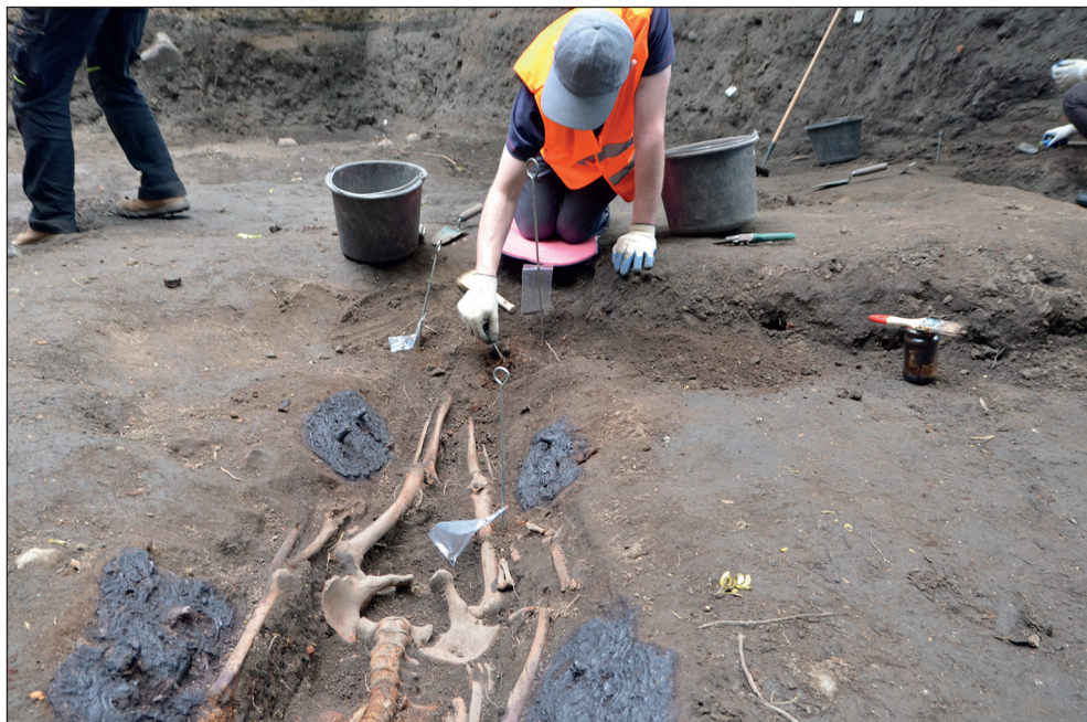
Ryc. 3. Stargard, przedmieścia miasta lokacyjnego, teren kaplicy św. Jakuba. Przygotowanie XVIII-wiecznego grobu z widocznymi okuciami trumny do dokumentacji rysunkowej i fotograficznej.