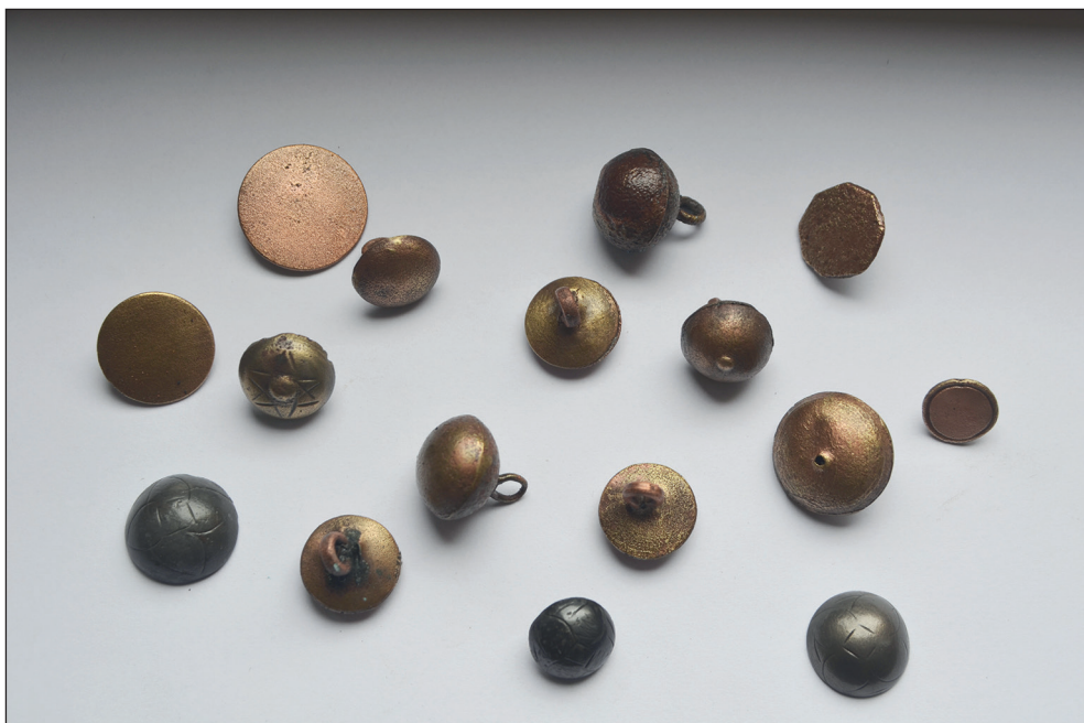
Ryc. 8. Zbiór guzików pochodzących z darów.